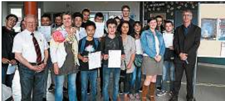
■ Les collégiens, diplôme précieux en main.

Une remise de diplômes bien sympathique au collège du Salagou