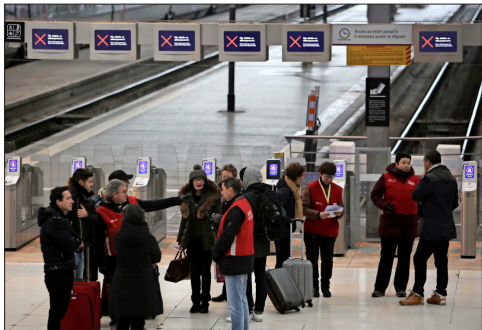
EL TRANSPORTE estuvo casi paralizado en gran parte del país y los franceses debieron enfrentar mucho tráfico.

En los colegios, la situación era de mayor normalidad. Alrededor de un 5% de los profesores